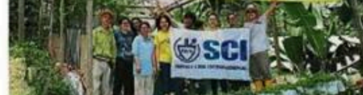
从孩子中，义工们学到了很多东西，义工们在菜圃中学习到很多。义工们在菜圃中学习到很多。义工们在菜圃中学习到很多。